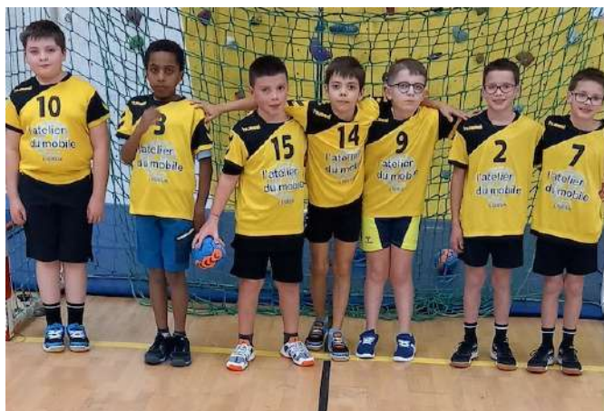
Moins de 11 poule B