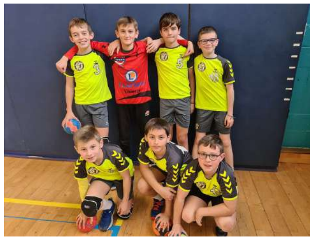
Moins de 13 garçons