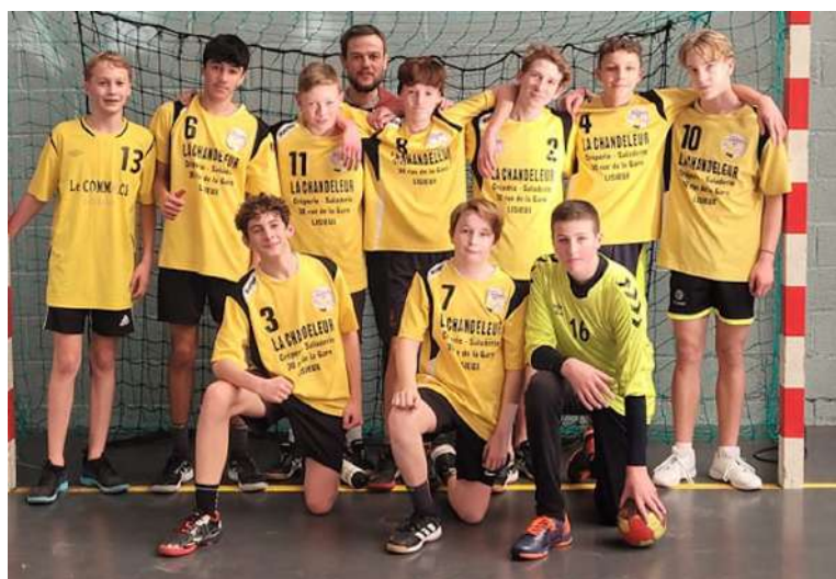
Moins de 15 garçons