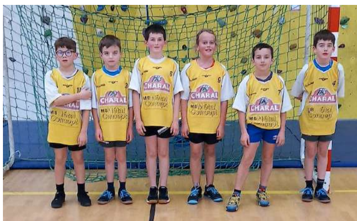
Moins de 11 poule G