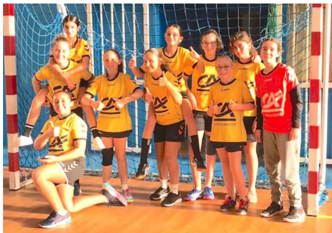
Moins de 13 filles