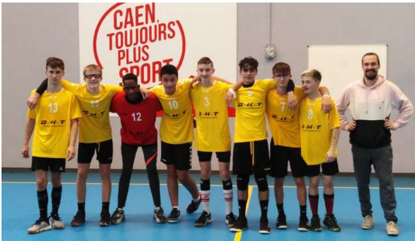
Moins de 17 garçons