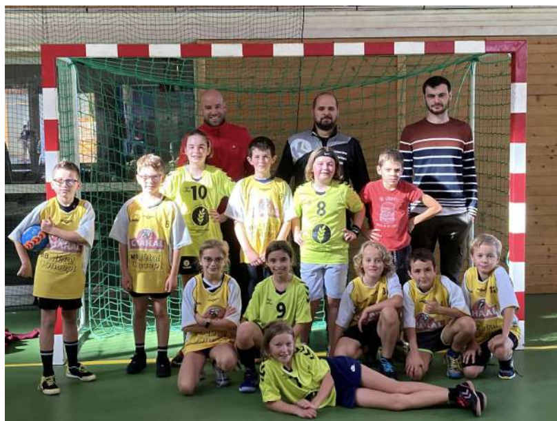
Moins de 11