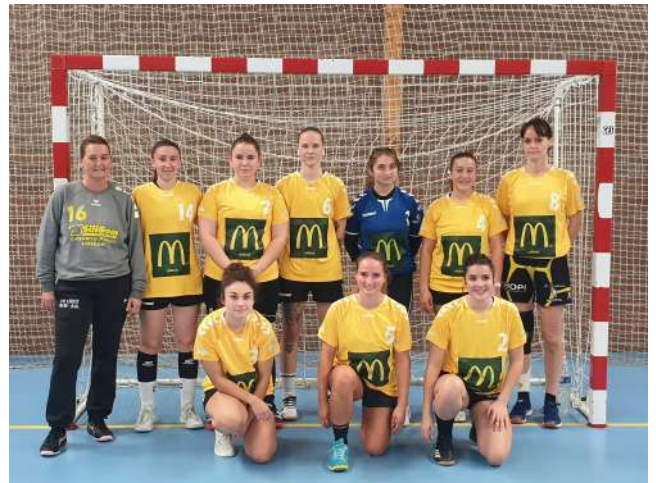
Première féminine Coupe de France