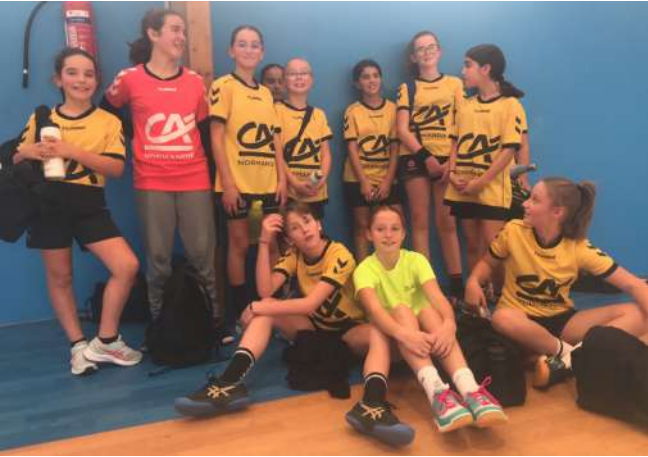
Moins de 13 filles