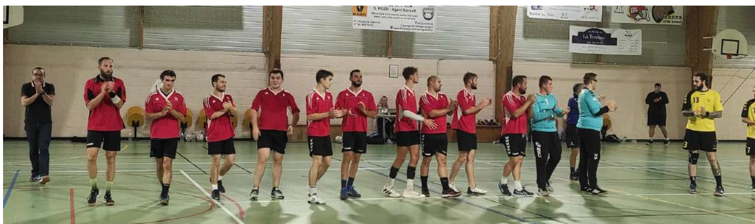
Première masculine Coupe de France

70 licenciés 21-22 sur 253 n'ont pas renouvelé leur licence en 22 23 : 27%