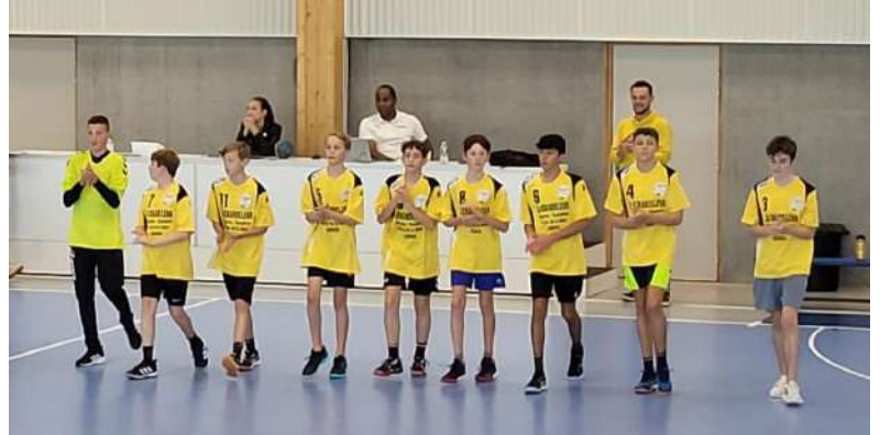
Moins de 15 garçons