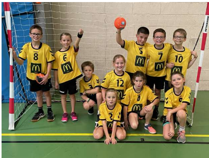
Moins de 9