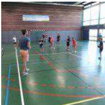
Entraînement pendant les vacances

Une expulsion ou une disqualification immédiate exclut le jeune du classement.