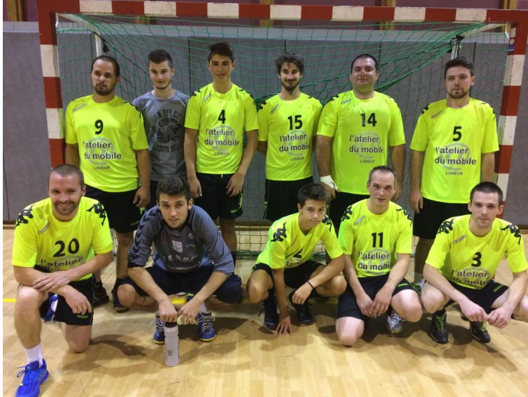
Equipe B Masculine