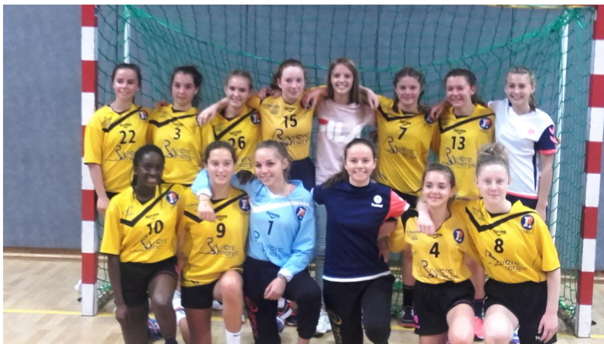
Moins 17 filles