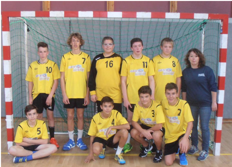
Moins 15 G Excellence

Une expulsion ou une disqualification immédiate exclut le jeune du classement général final