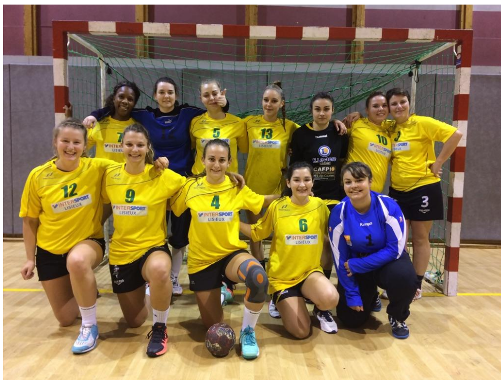
Equipe B Féminine

En conséquence, je vous serais gré, qu'au regard des faits précédemment énoncés, que vous reveniez sur la décision de Monsieur Le Maire Adjoint chargé des Sports, nous concernant..... »